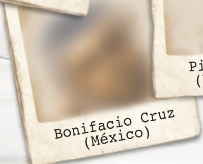
Bonifacio Cruz (México)